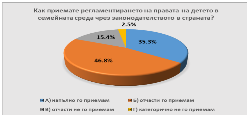
Фиг. 3 Мнение на родителите за приемане на законовото регламентиране на правата на детето.

Степента на приемане от родителите на законовото регламентиране на правата на детето е представена на фиг.3.